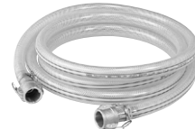
水中ポンプ用耐圧ホース