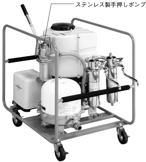
ステンレス製手押しポンプ